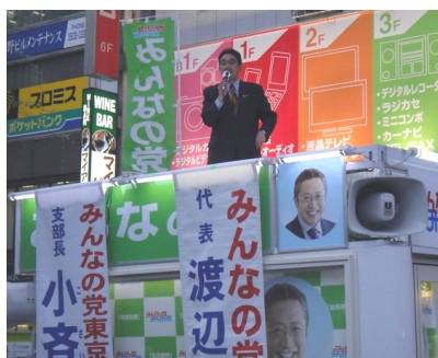
街頭演説(新橋駅SL前にて)