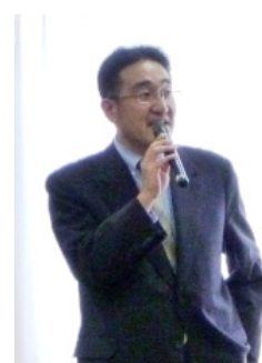
報告会講演中(南青山会館にて)